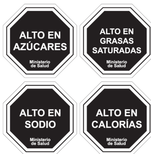
Diagrama N° 1

Las características gráficas de los descriptores nutricionales señalados en el Diagrama N°1 serán las siguientes: